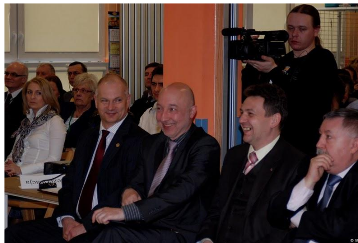
Władze Zgorzeleckiej Ziemi